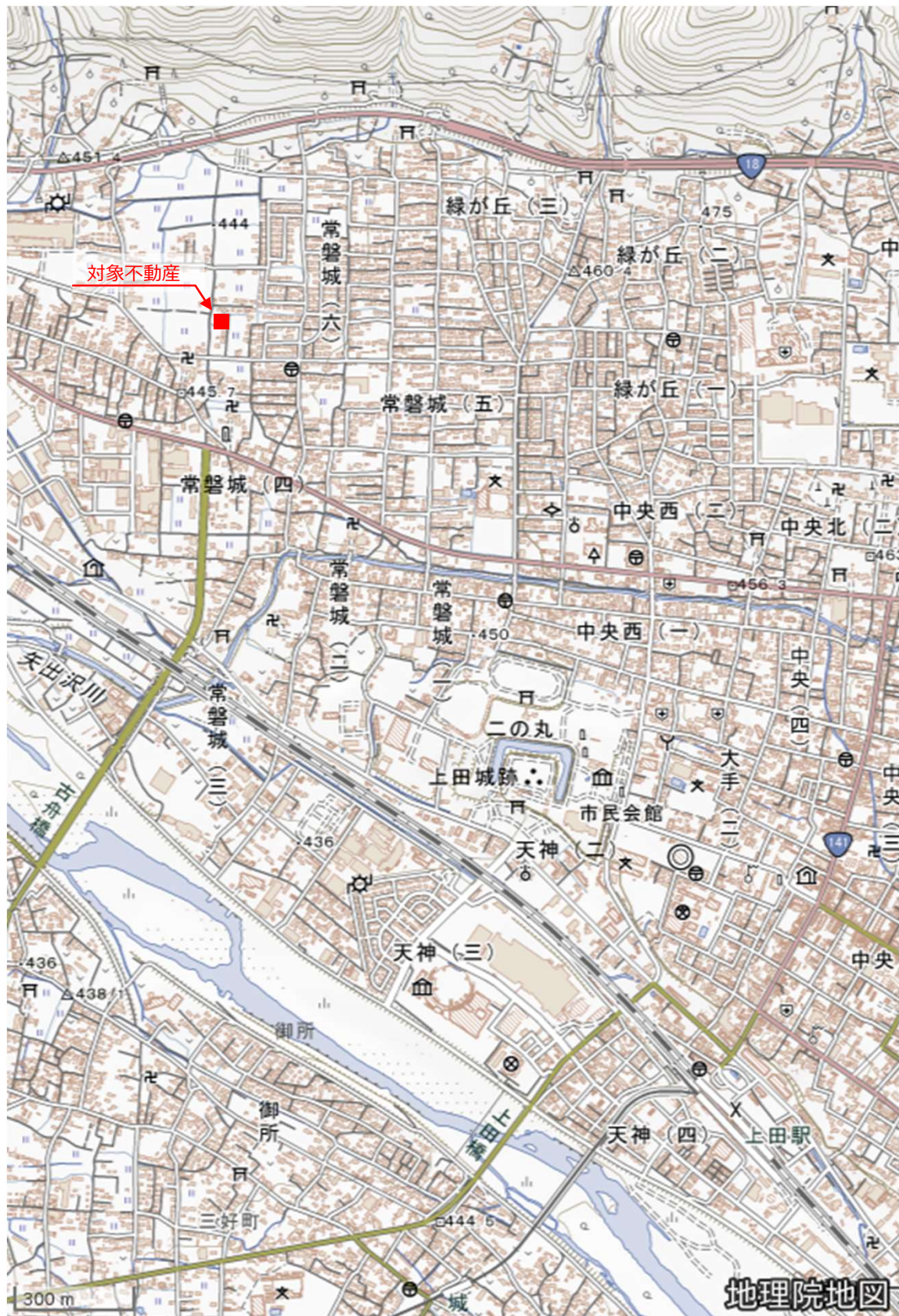
対象不動産位置図 1